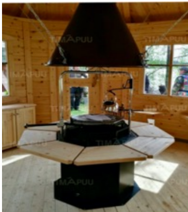
Polar Grill L8